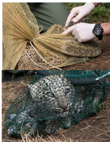
Рис. 3. Отлов и вакцинация котят леопардов

При этом контакт леопардов с человеком во время кормления в вольерах разведения носит систематический характер и по причине ограниченной площади вольеров является неизбежным. В связи с этим для исключения формирования положительных связей сознании леопардов по отношению к человеку и