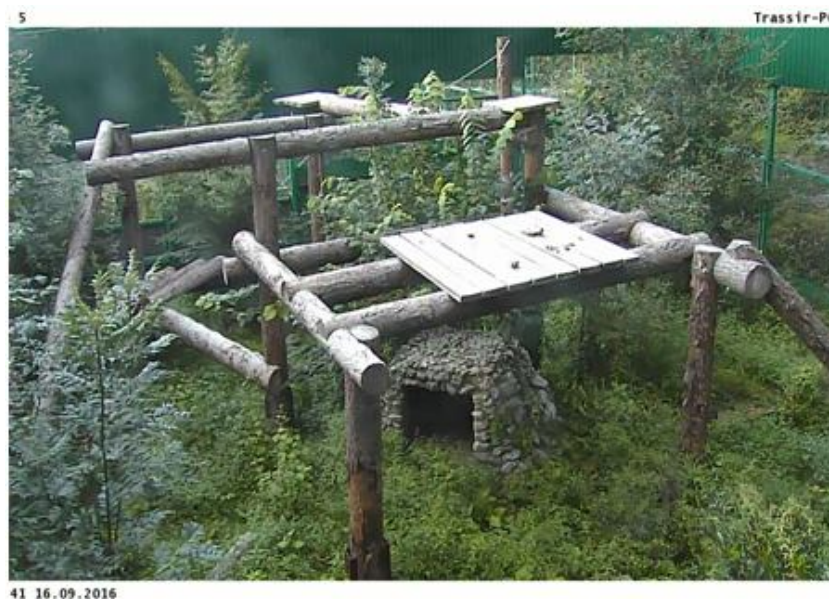
Рис. 2. Деревянная 3D конструкция в вольере разведения

Поддержанию врожденного страха перед человеком уделяется особое внимание, учитывая тот факт, что залогом успешного выживания хищников в природе является проявление особой формы оборонительно-