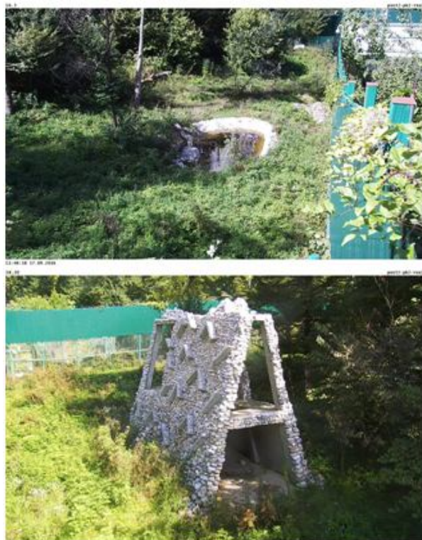
Рис. 4. Искусственные озеро и скала

Также вольеры подготовки к выпуску характеризуются сложным рельефом и обустройством специализированных элементов обогащения среды: искусственные озера и скала, деревянные 3D конструкции и приспособления для дачи корма (рис. 4).