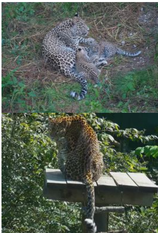
Рис. 1. Самки с котятми в возрасте 2х месяцев

котятми возраста 4 месяцев самки содержатся в вольерах разведения (рис. 1).